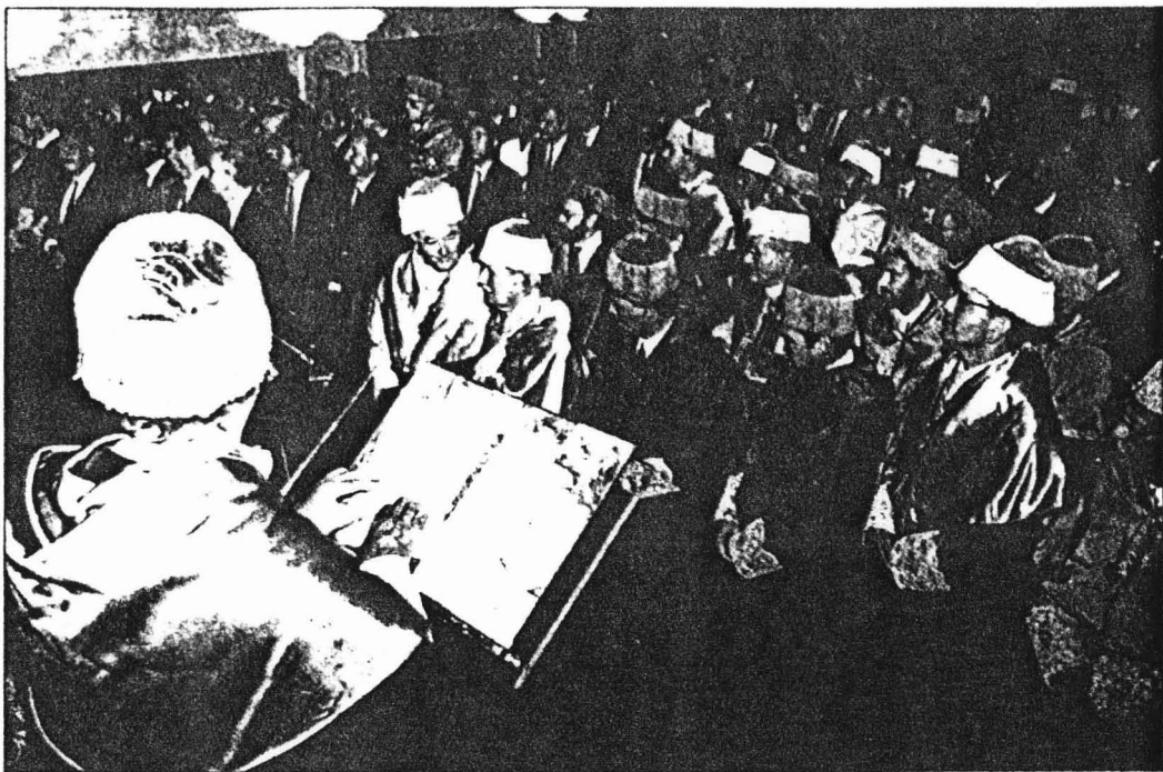
Diversos proyectos realizados en Canarias están acogidos al plan nacional de investigación.

La ausencia de suficientes mecanismos institucionales de evaluación tecnológica, impide un mejor aprovechamiento de los presupuestos destinados a investigación. De ahí que, en España, este sector esté considerado como tapado, a pesar de que sobre las relaciones universidad-empresa descansa uno de los pilares del futuro tecnológico e industrial de cualquier país desarrollado.