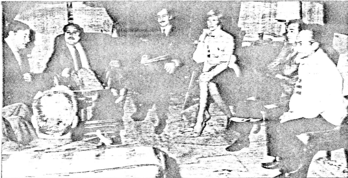
Miembros del Club Familiar Canario, durante la recepción con el gobernador civil de Las Palmas.